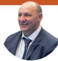
José Lucas Mena "Pato"

Cuatro veces Campeón de Europa (2007, 2010, 2012 y 2016) con la Selección Española Dos veces Subcampeón del Mundo en 2008 y 2012 con la Selección Española Campeón del Grand Prix 2010 en Brasil Campeón del Mundo (2000) y de Europa de Clubes (2000) con el Caja Segovia Campeón de liga LNFS (1999) con el Caja Segovia tres veces Campeón de Copa, con Caja Segovia (1999, 2000) y Lobelle de Santiago (2006).